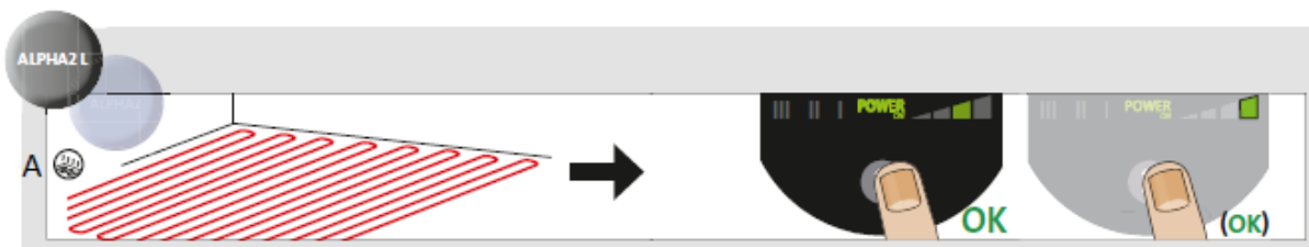
Afb. 3 Keuze van pomp instelling voor systeemtype

Fabrieksinstelling / aanbevolen = Hoogste constante druk curve (CP2)